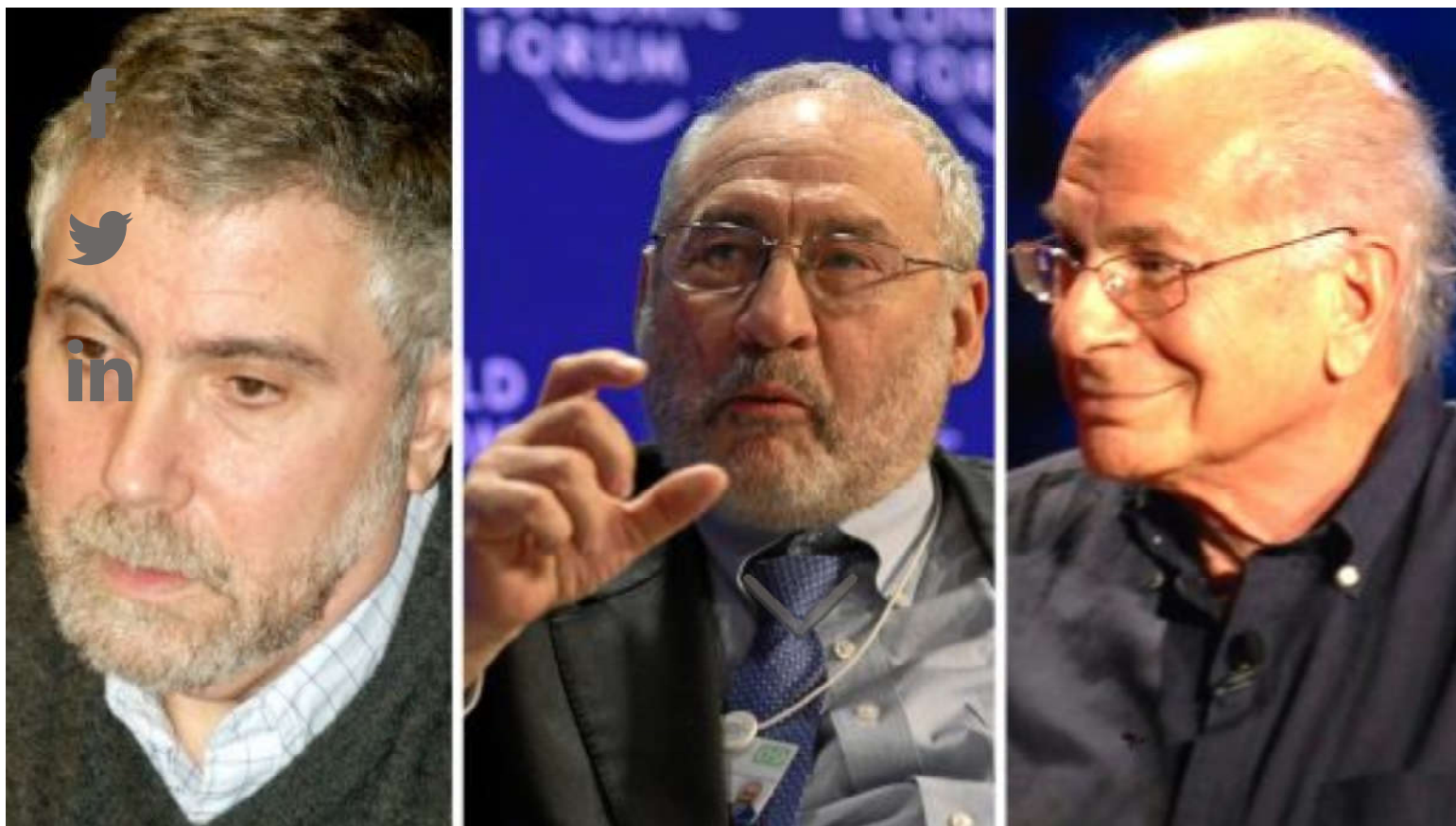
Paul Krugman, Joseph Stiglitz și Daniel Kahneman, trei dintre laureații Nobelului pentru Economie, nu întrunesc criteriile de profesorat în România.